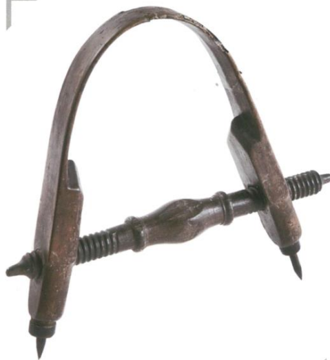
Compas du XIX e siècle